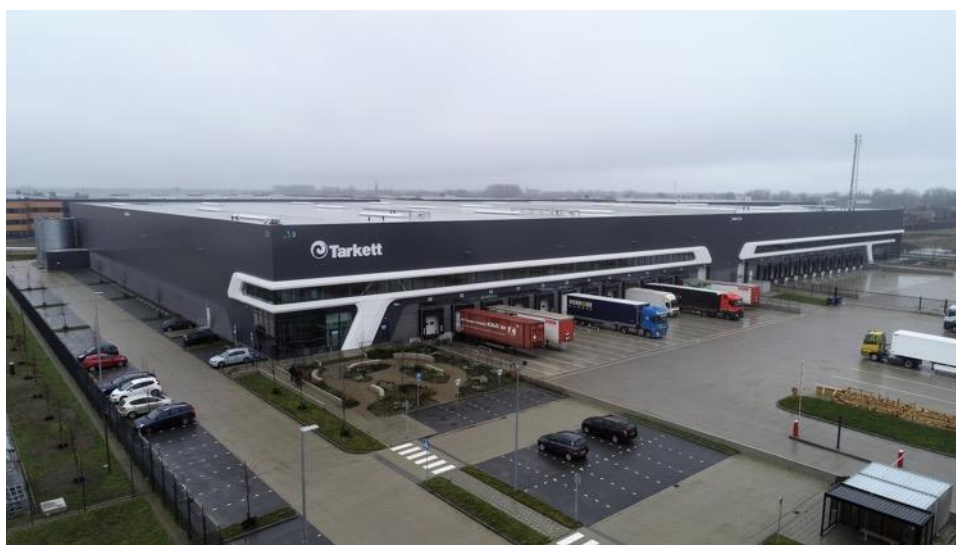
Het nieuwe distributiecentrum op bedrijvenpark Prologis Park Waalwijk telt 26.000 m 2 . Iets meer dan de helft hiervan wordt gehuurd door Tarkett.

Het te krappe jasje resulteerde daarnaast in efficiencyverlies. Als gevolg van het ruimtegebrek was Tarkett genoodzaakt om delen van de voorraad op andere locaties op te slaan. "Op een gegeven moment moesten we zelfs externe opslagruimte huren. Met onnodige handling en extra transportkilometers tot gevolg", vervolgt Van der Zanden. "Bovendien kwam daardoor de leverbetrouwbaarheid en de service naar onze klant in gevaar. Ruimte genoeg voor verbetering."