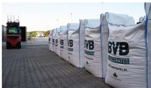
BVB Substrates is Europees marktleider voor professionele telers.