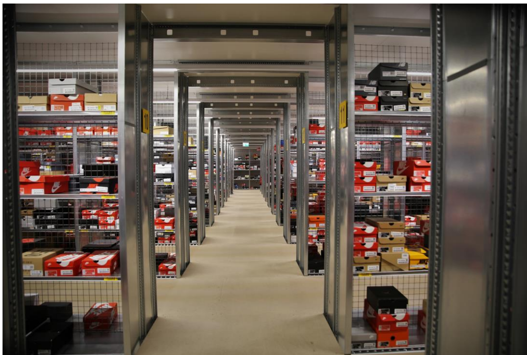
De slim geplaatste stellingen garanderen een hoge opslagdichtheid en bieden plek voor 200.000 items.