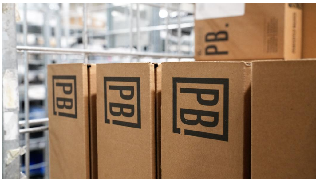
Perfectly Basics, kort PB, groeide in rap tempo uit tot een professionele webshop voor en veelal door vrouwen, met een focus op slow fashion en een persoonlijke touch.

Het was dan ook geen moment te vroeg toen de buurman begin 2023 aanklopte en vroeg of PB interesse had om het aanpalende pand te huren. "Daarmee konden we ons bestaande magazijn van 1.000 m 2 in één klap uitbreiden met nog eens 850 m 2 . We hoefden dan ook niet lang na te denken en besloten het pand voor een periode van vijf jaar te huren", vertelt Aldenkamp.